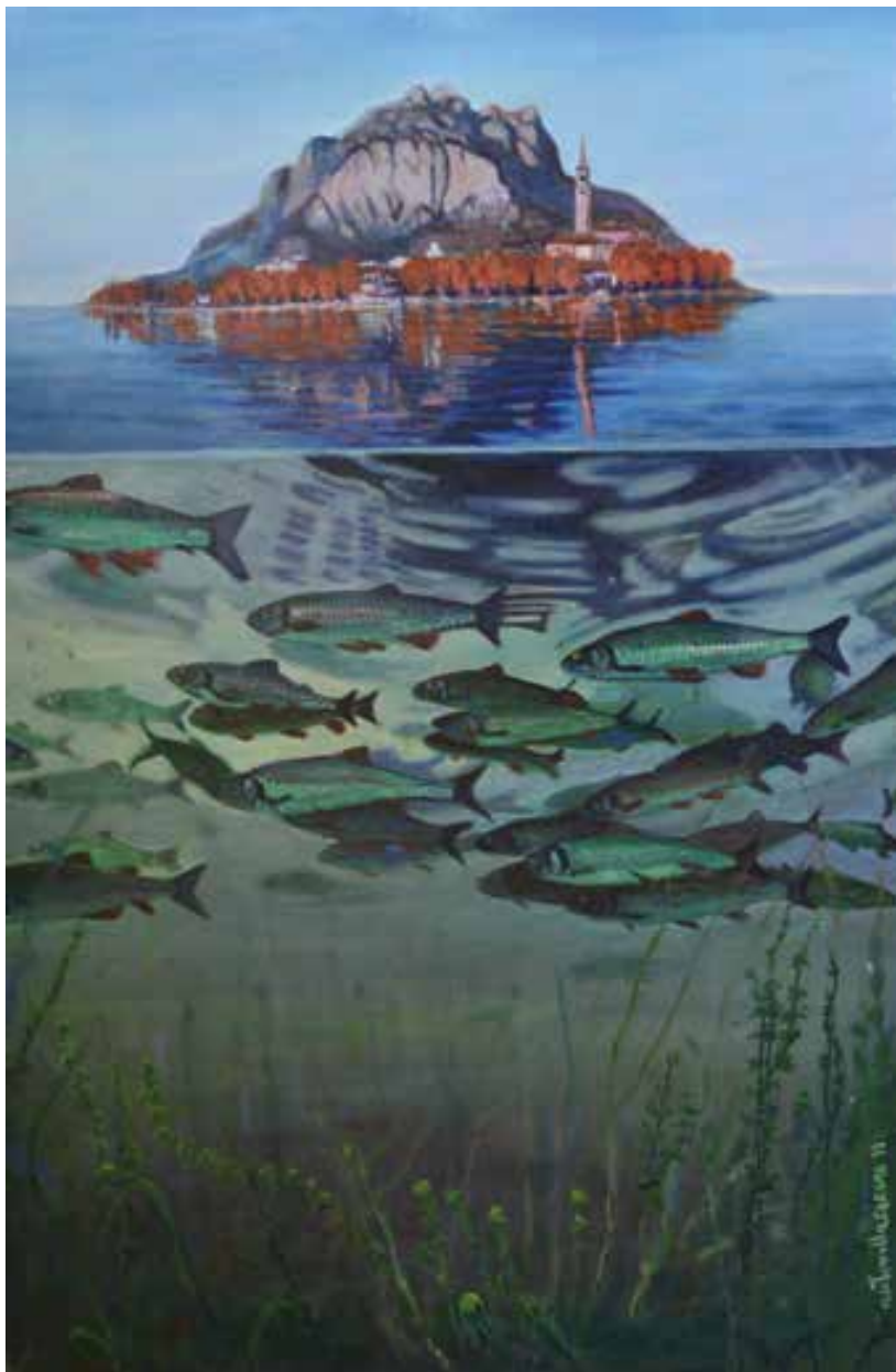
L'ISOLA CHE NON C'E' - 80x120 cm.