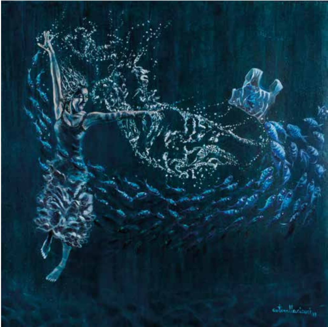
ATLANTIDE - 90x90 cm.

2° PREMIO CONTEST - WEPLANET - MILANO - 2021