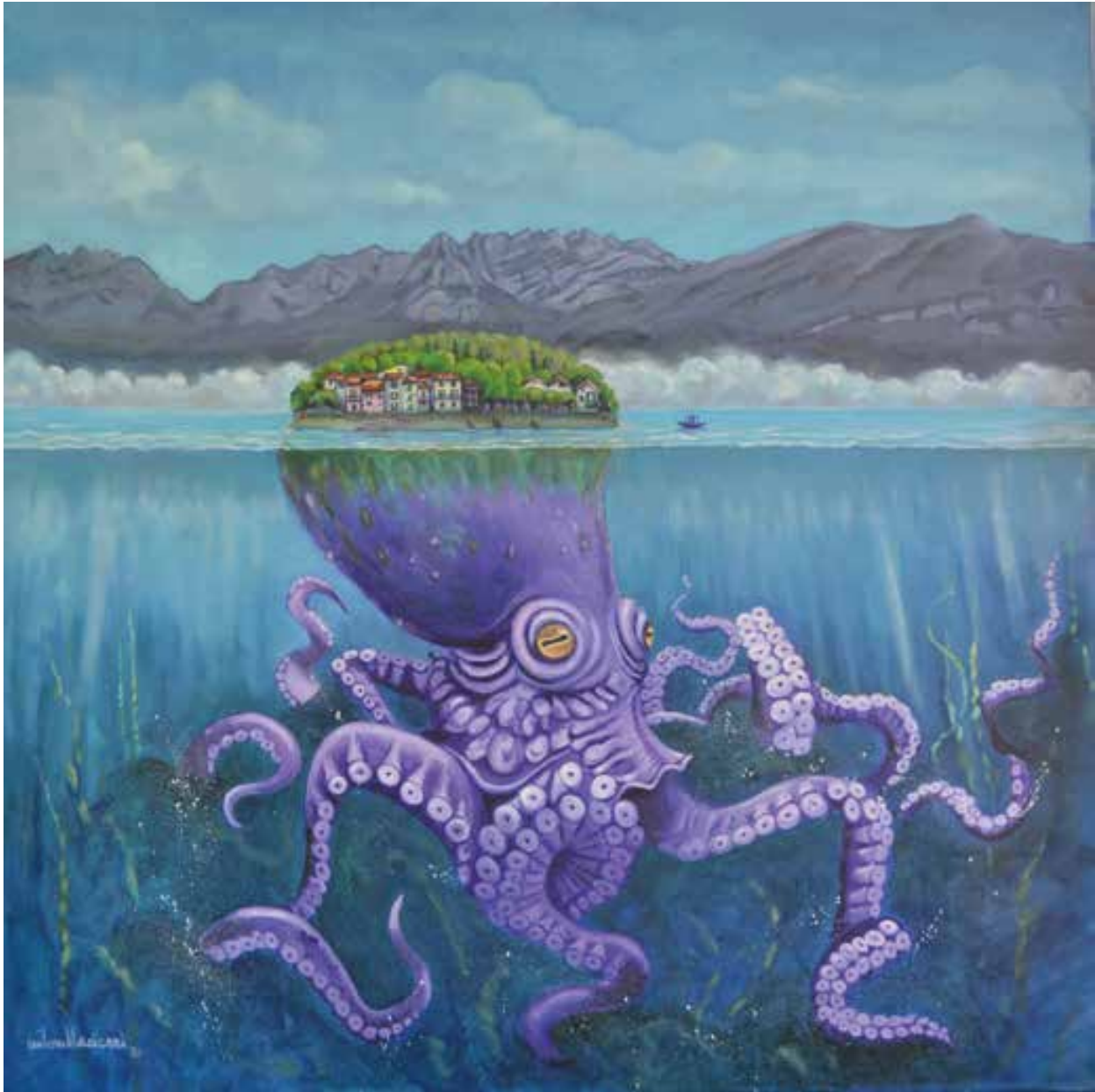
LA LINEA SOTTILE - 90x90 cm.