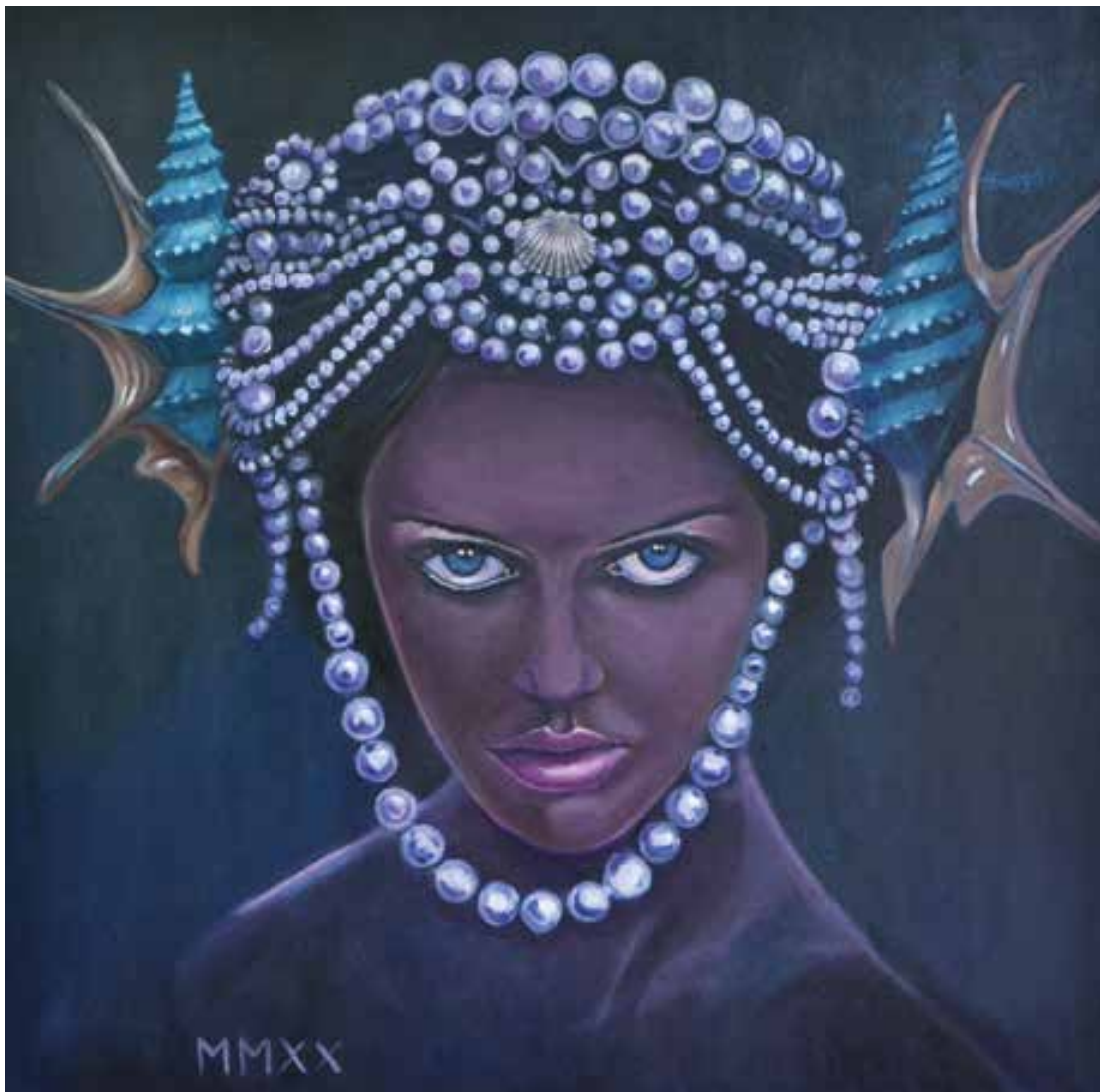
MMXX - 90x90 cm.

Lo svelamento del lato sommerso della realtà non presenta mai una visione opposta o in contrasto rispetto alla superficie, propone piuttosto un'alternativa, un altro presente pulsante: una dimensione parallela che non si colloca in un lontano altrove, ma a pochi metri da quella in cui viviamo ogni giorno. Non esistono un sotto e un sopra, si riconoscono piuttosto infinite serie di tempo: un presente fatto di molteplici presenti che coesistono infilati uno nell'altro, vicini e lontani nello stesso momento. Caterina Rossato / Artista e Direttore Creativo.