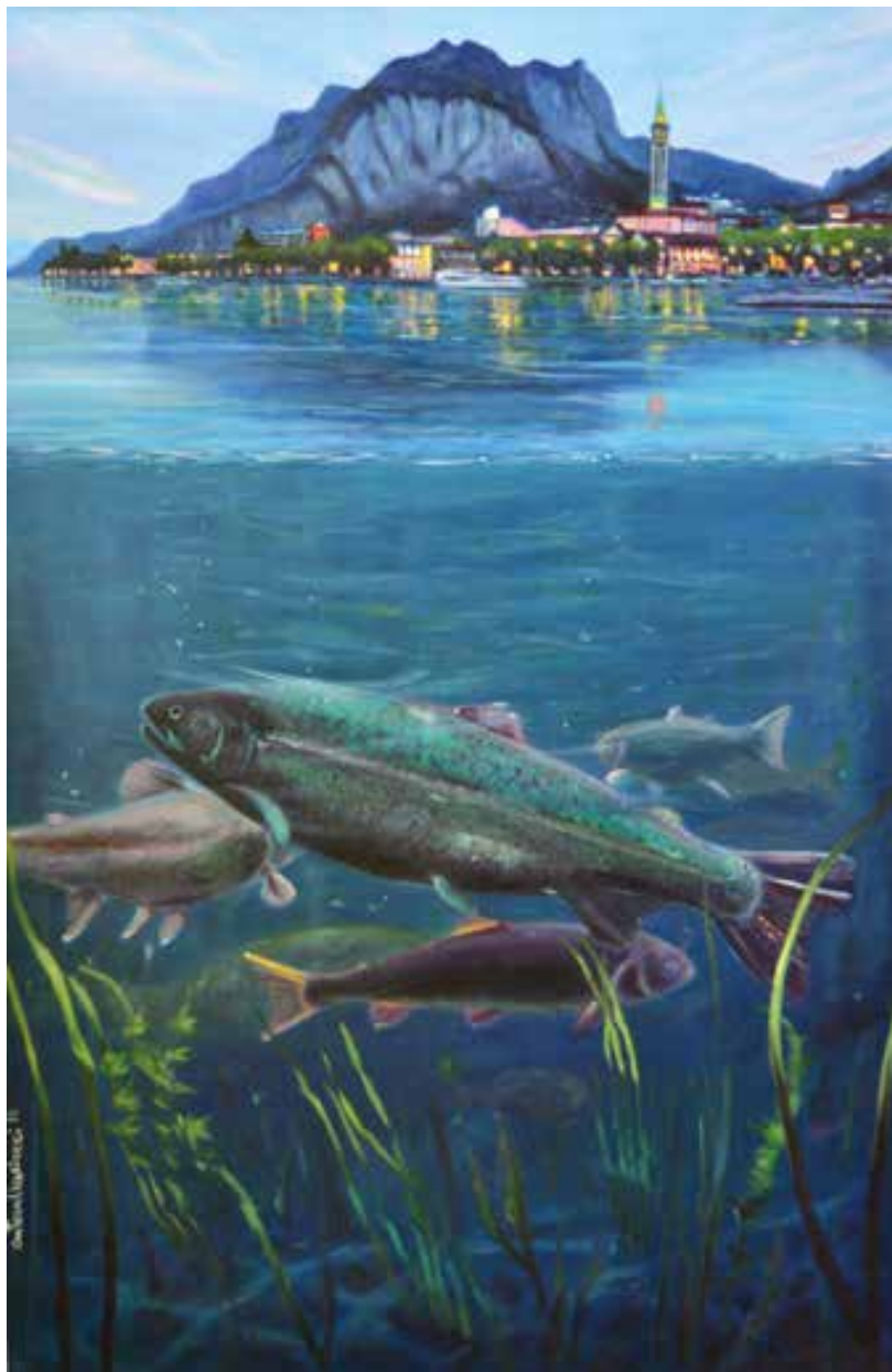
SOTTOSOPRA LECCO - 80x120 cm.

OPERA ESPOSTA PRESSO SCUOLA GRANDE SAN TEODORO - VENEZIA - 2018