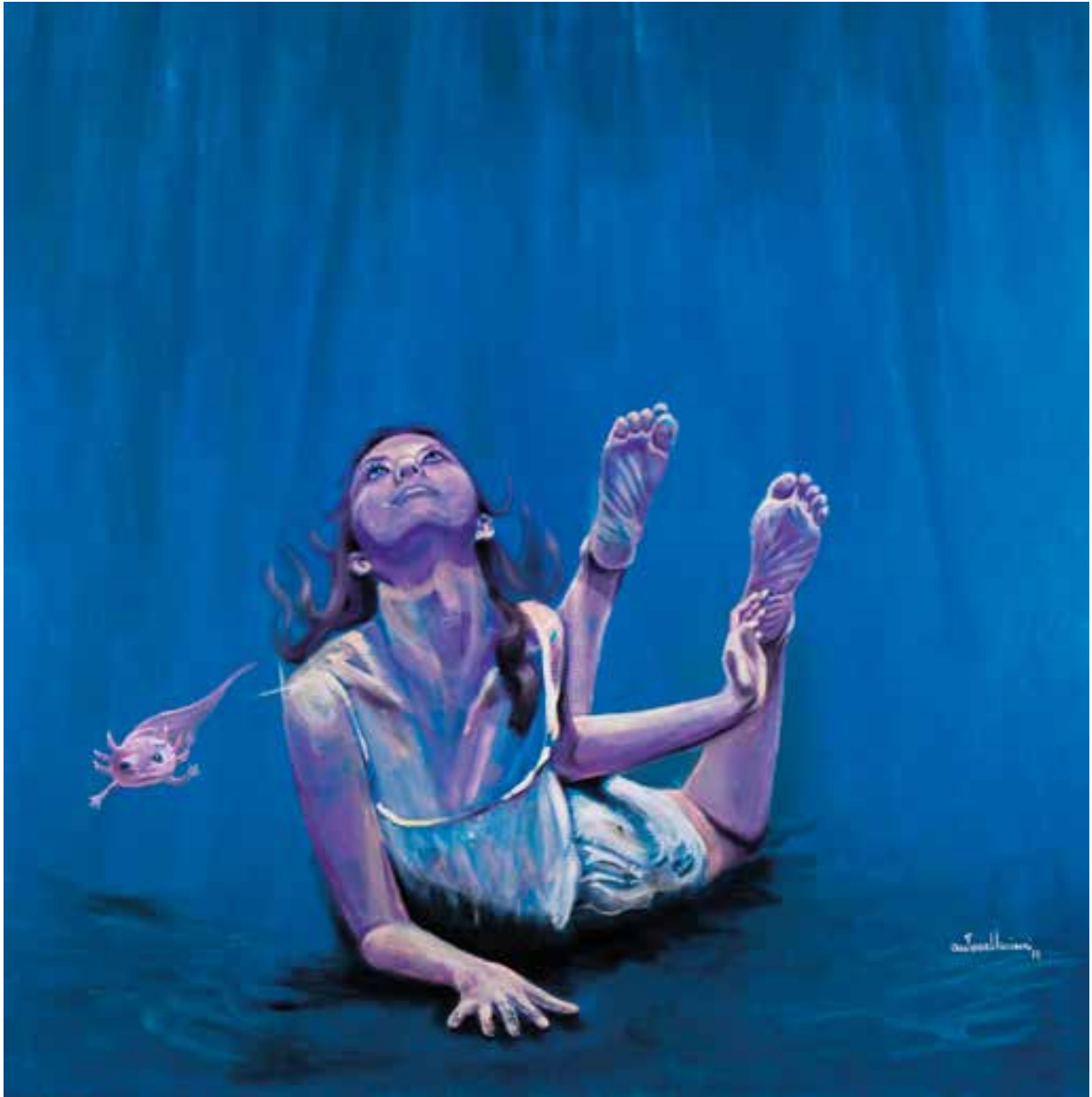
INDACO - 90x90 cm.

PREMIO INTERNAZIONALE CITTA' DI NEW YORK - 2020