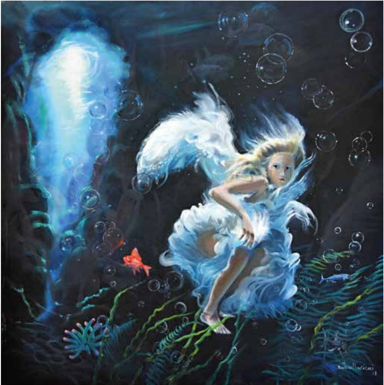
LA VITA FINORA - 80x80 cm.

OPERA ESPOSTA PRESSO PALAZZO VELLI - ROMA - 2019