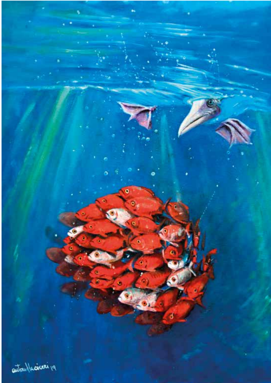
SIAMO IN ONDA - 50x70 cm.