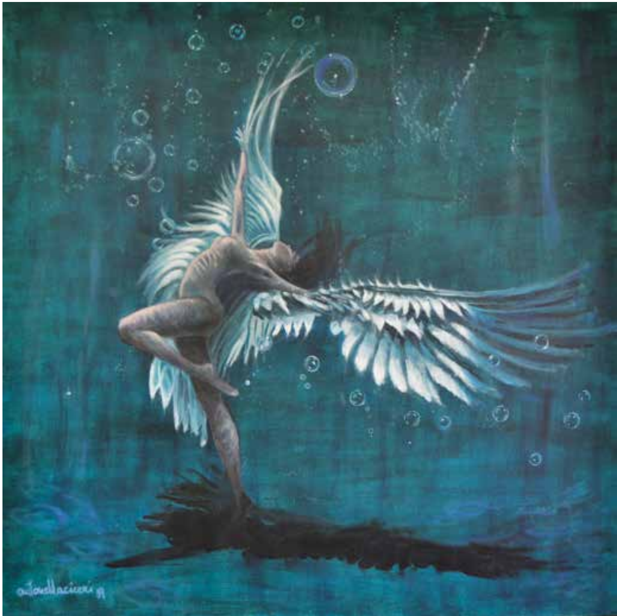
ACQUAFORTE - 90x90 cm.