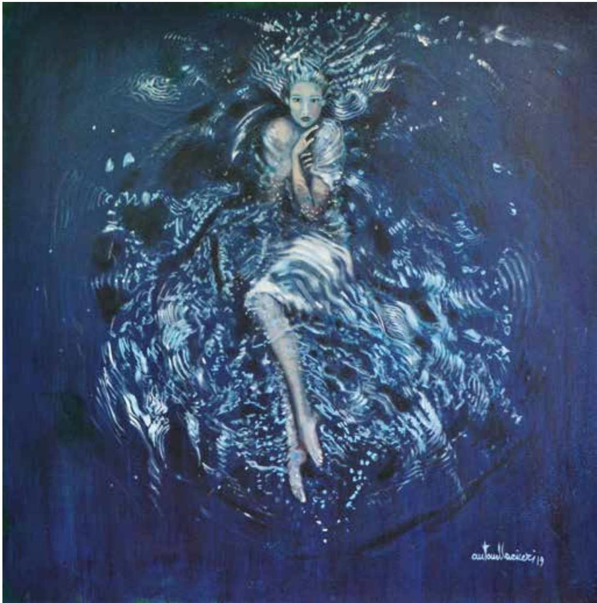
FORSE MI TROVO - 90x90 cm.