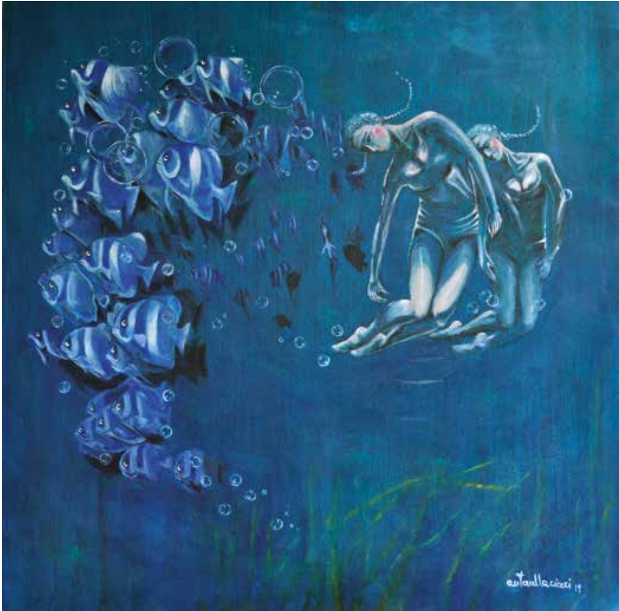
SOTTO IL SEGNO DEI PESCI - 90x90 cm.