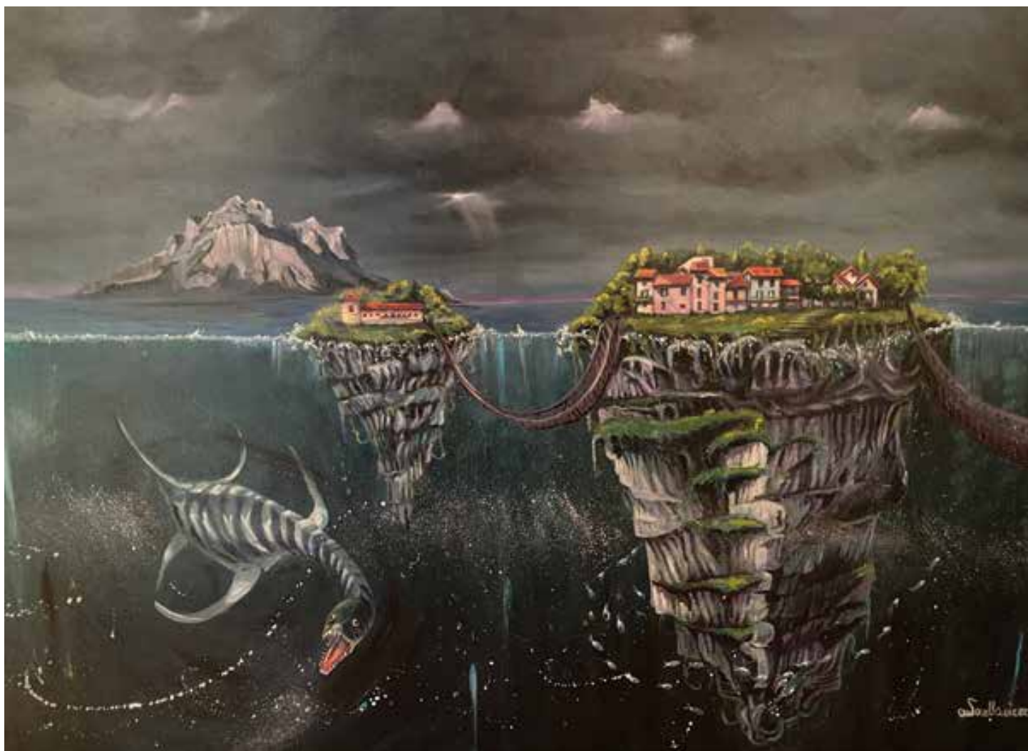
SOTTOSOPRA LARIOSAURO - 100x80 cm.