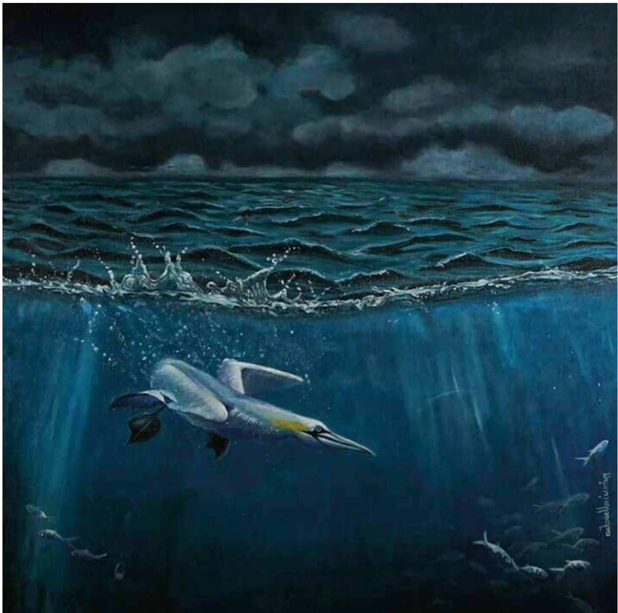
RIDAMMI IL CIELO - 90x90 cm.