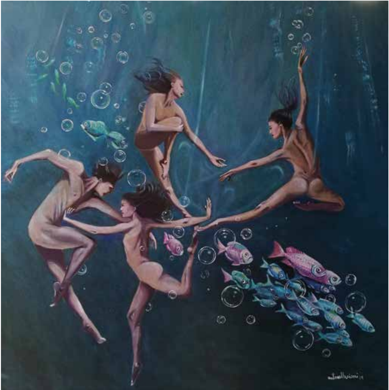
BALLANDO SUL MONDO - 80x80 cm.