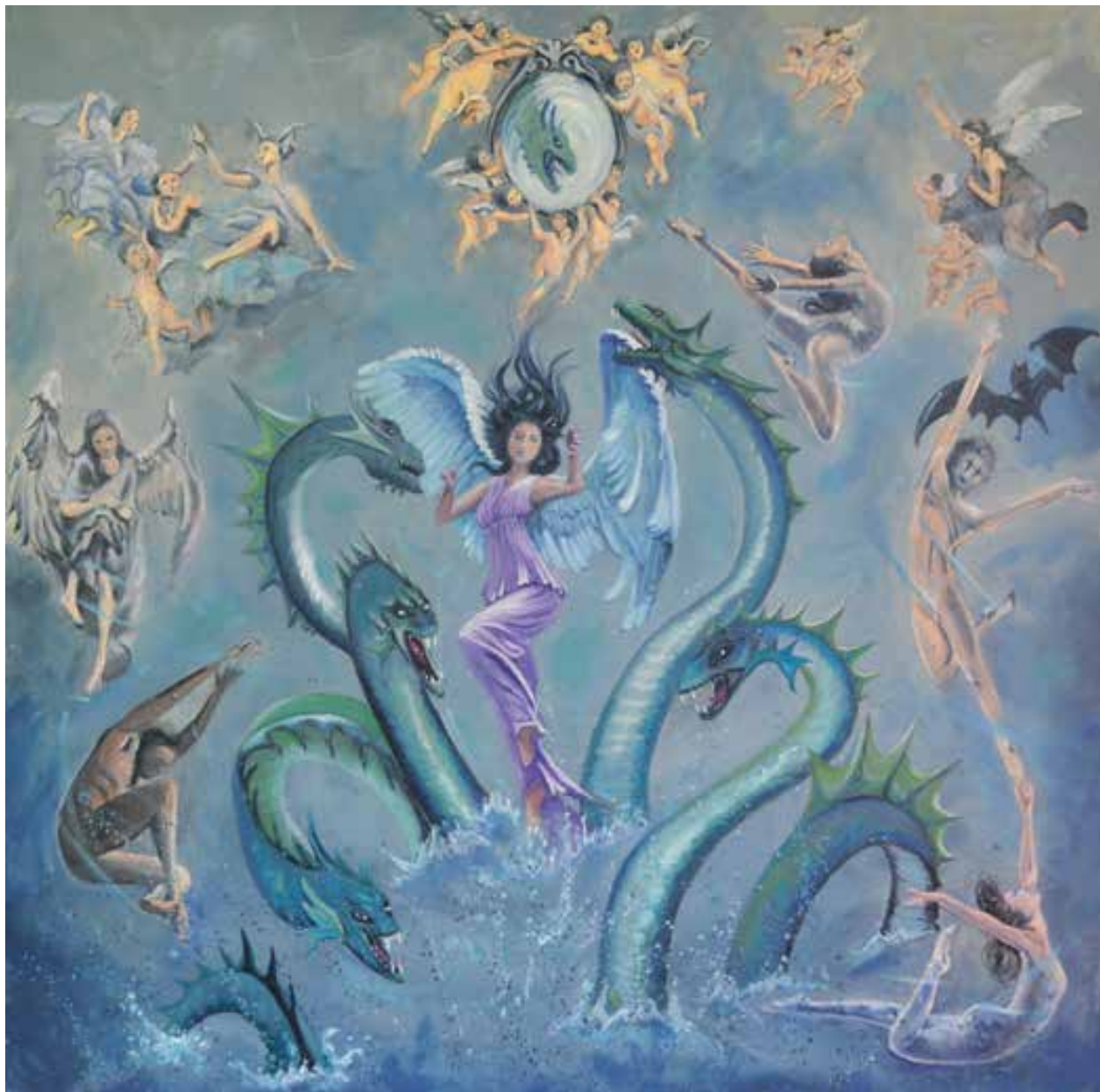
NIENTE DI NUOVO - 90x90 cm.