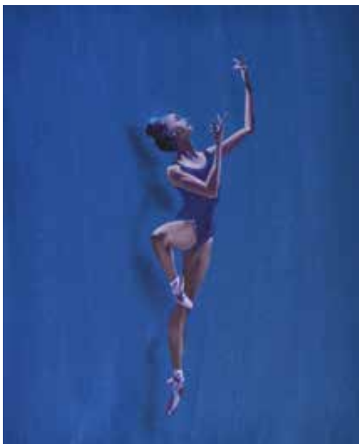
C'E' UN ALTRA LUNA