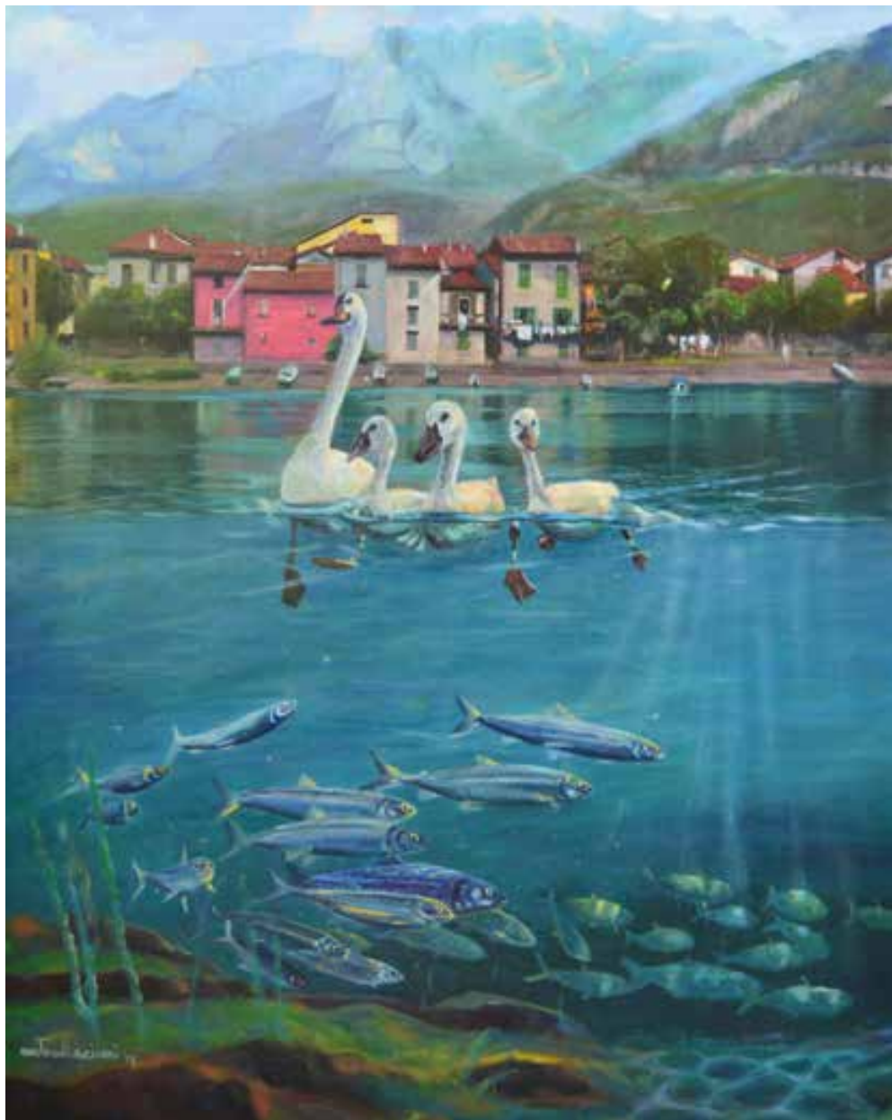
SOTTOSOPRA PESCARENICO DI LECCO - 80x100 cm.

OPERA ESPOSTA PRESSO GALLERIA FARINI - BOLOGNA - 2018