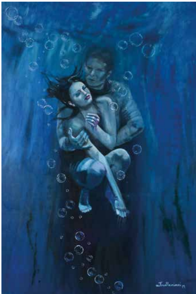
FUORITEMPO - 100x130 cm.