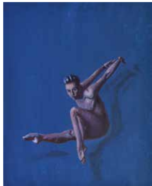
NIENTE DI PIU'