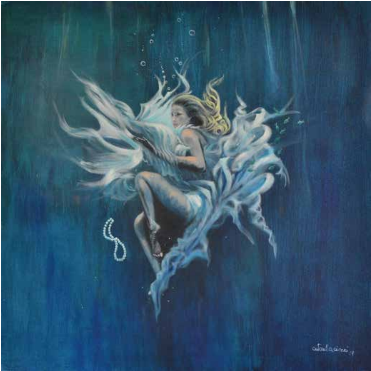
DOVE L'ACQUA E' PIU' BLU - 90x90 cm.