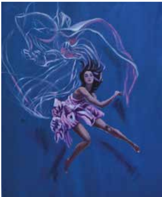
CI SEI SEMPRE STATA