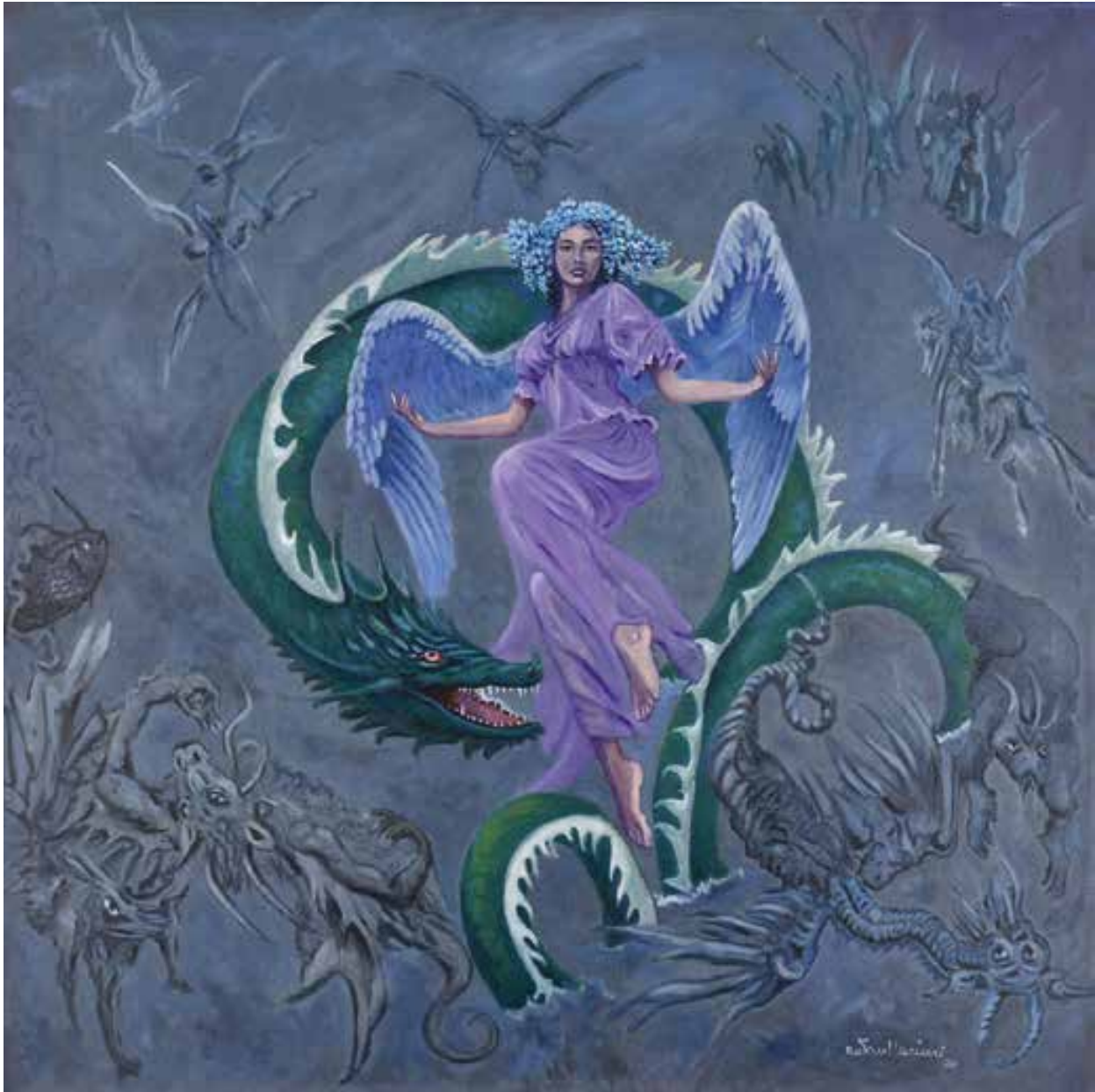
SPIRITO NEL BUIO - 90x90 cm.