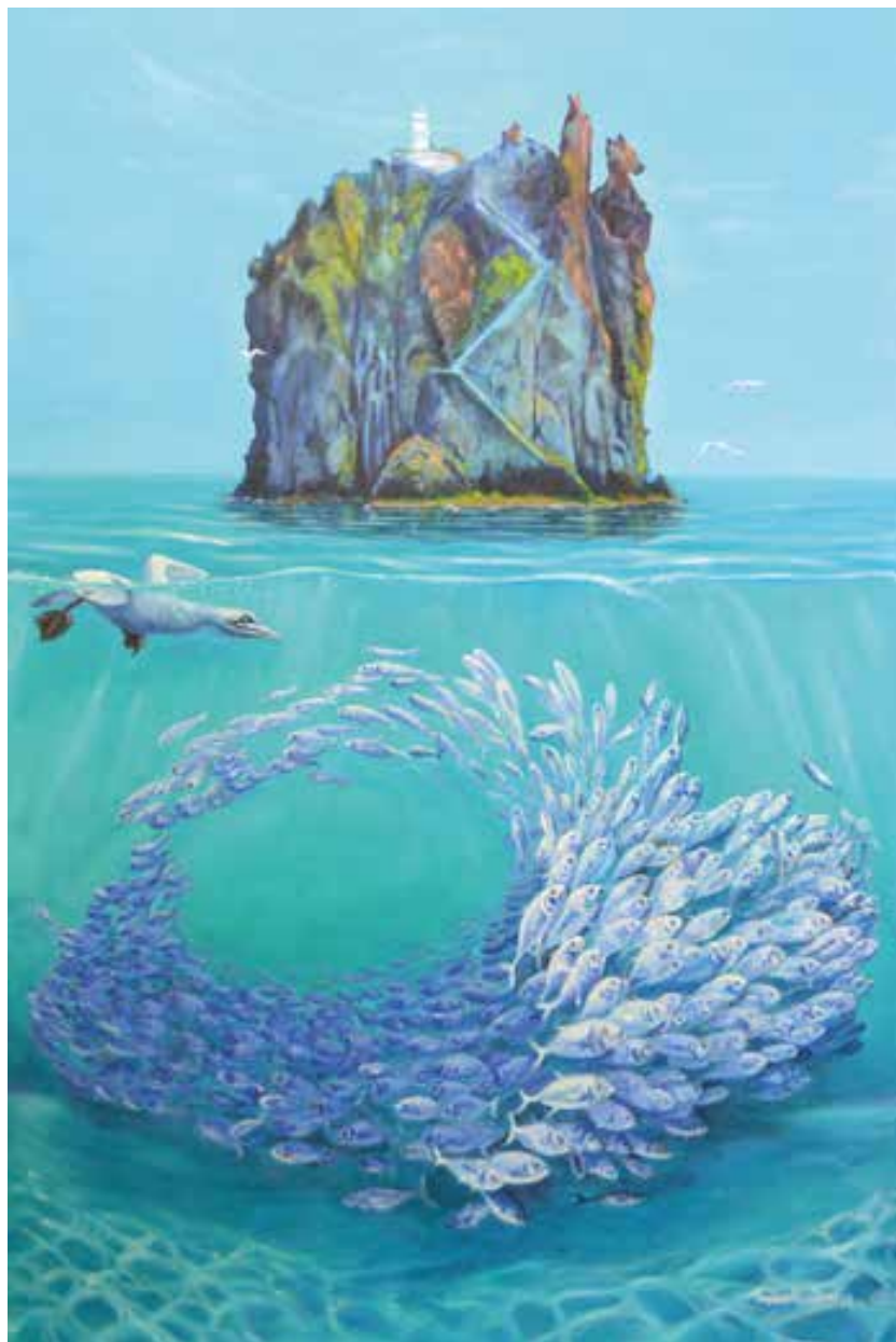
SOTTOSOPRA STROMBOLICCHIO - 80x120 cm.

OPERA ESPOSTA PRESSO SCUDERIE ESTENSI - TIVOLI - UNESCO 2019