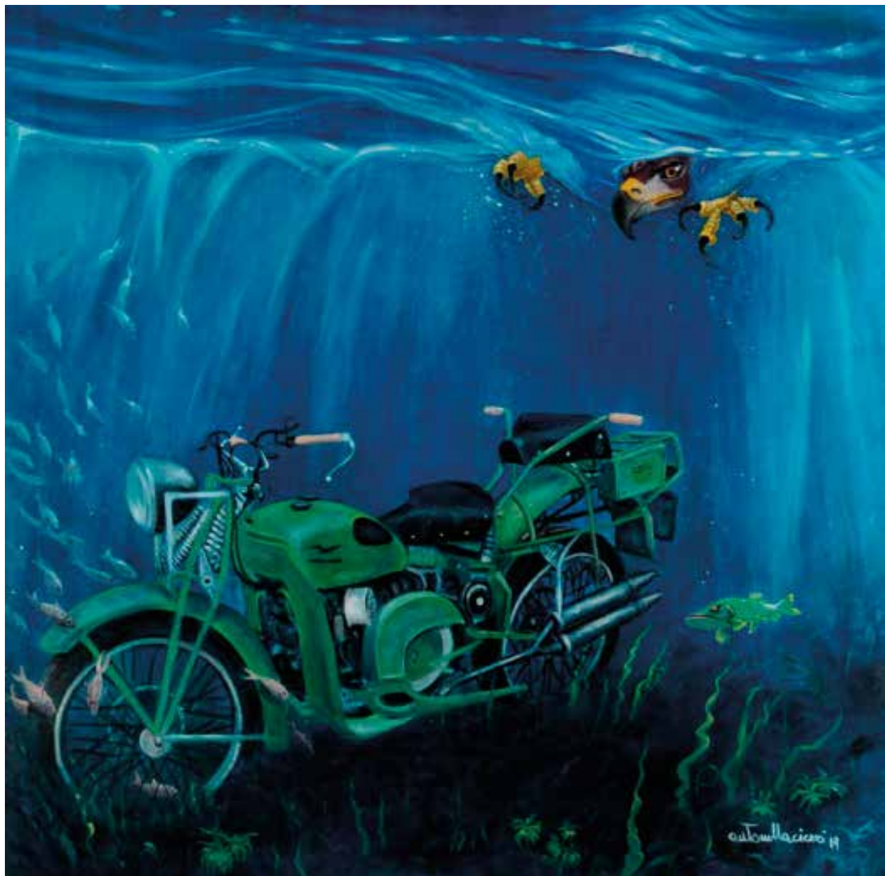
SUPERALCE - 90x90 cm.