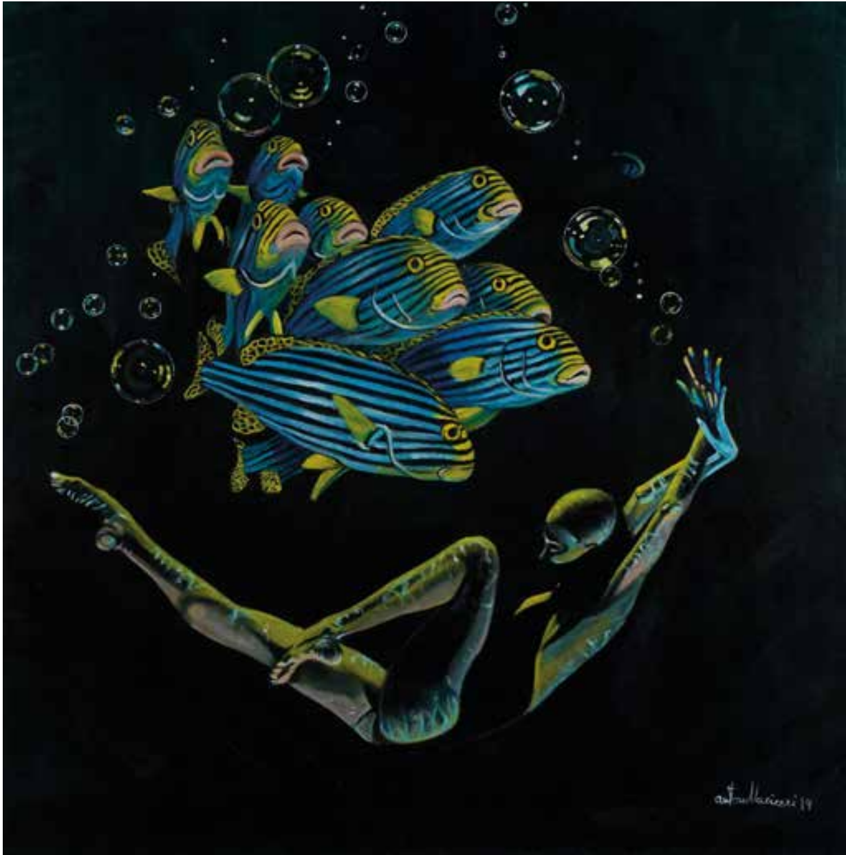
LASCIAMI IL TEMPO - 90x90 cm.